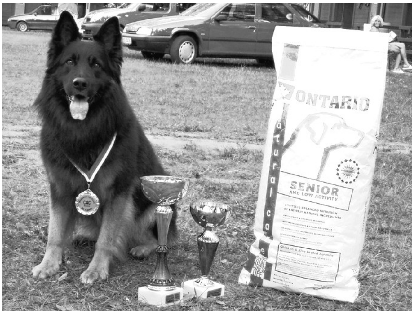
Klubový vítěz Sirius od Strážné skály