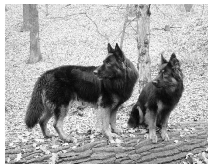
Sirius od Strážné skály a Principio Lukato Gold