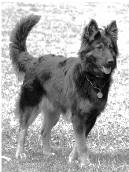
Bessi od Motyčinské skály

tisku zaslala L. Svobodová předsedkyni, která následně rozesílá ostatním členům výboru i RK (tento postup funguje). Všichni jsou povinni případné opravy, doplňky k obsahu zpravodaje zaslat L. Fejerové do 5 dnů (zkrácená lhůta oproti původním 14 dnům) po obdržení. Připomínky má L. Fejerová zpracovat do jednotné formy a obratem zaslat L. Svobodové pro konečné zpracování. Jestliže nebude nadále fungovat výše uvedený postup, bude na příští schůzi výboru projednáno nové složení redakční rady.