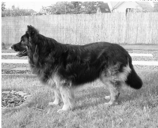
Brixx Barracuda Acces