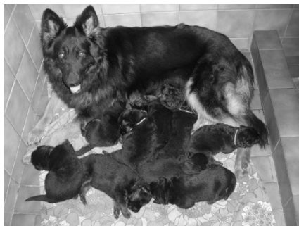
vrh W Bryvílsár