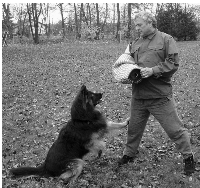
Brixx Barracuda Acces