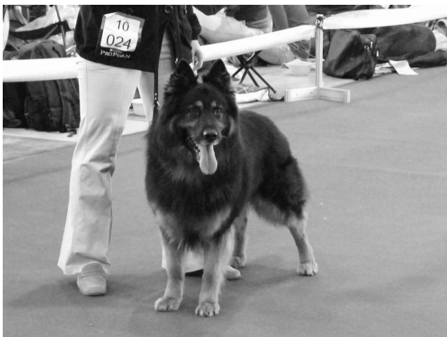
Cid Stamo Bud