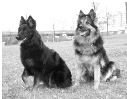
Annie Dar minulosti a Olivie z Gipova