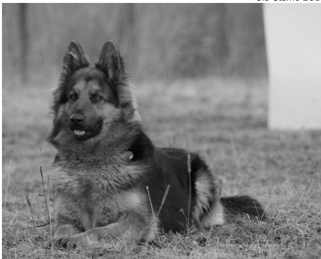
Artea Vita Canina