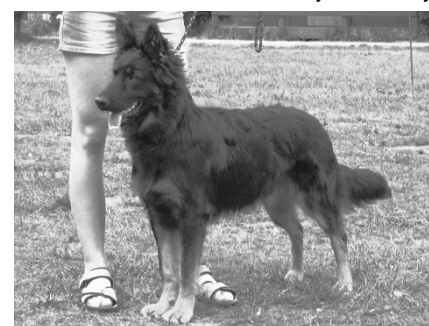
Bela od Motyčinské skály

Svod a bonitace, výstavy – cestovné a posudečné - rozhodčí dle směrnice ČMKU, členové komise (na výstavě vedoucí kruhu, zapisovatel a garant akce) cestovné dle předložených jízdenek nebo při jízdě autem v současné době 4 Kč/km, posudečné při počtu do 20 zvířat 200 Kč, nad 20 zvířat 400 Kč, občerstvení v kruhu, garant akce (hlavní pořadatel) možnost proplacení doložených nákladů spojených s akcí - veterinář, pronájem areálu, poštovné, event. náklady na tisk katalogů, posudků, ceny pro vystavovatele.