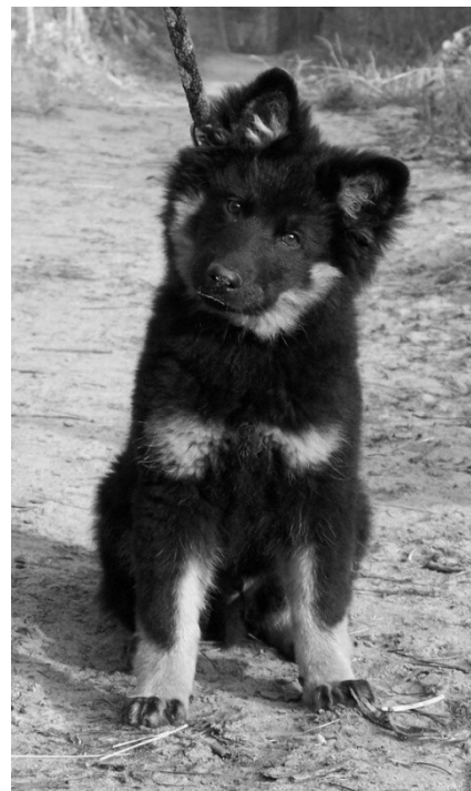
Cirius z Letínské kovárny ▲ ilustrační ▼