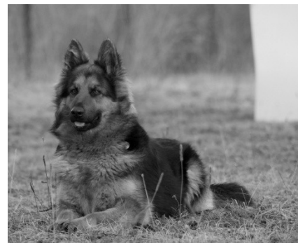
Artea Vita Canina