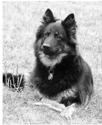
Arina z Cardova dvora