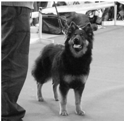
Beatrice z Letínského kovárny