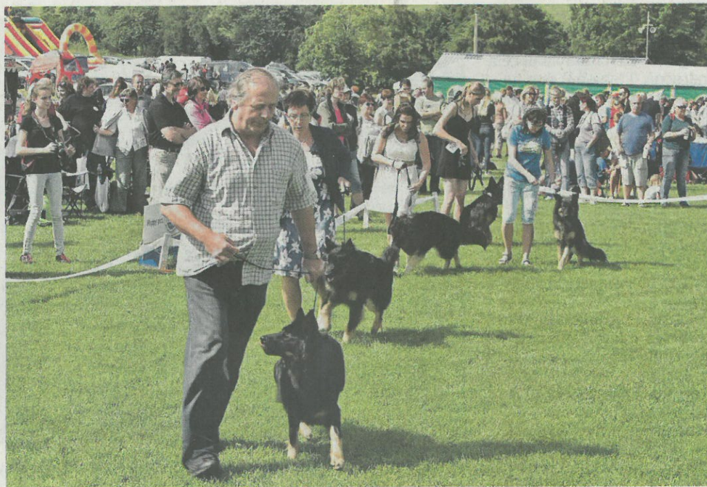
FOTBALOVÉ HŘIŠTĚ V CHODSKÉ LHOTĚ bylo v sobotu plné psů a jejich pániček.