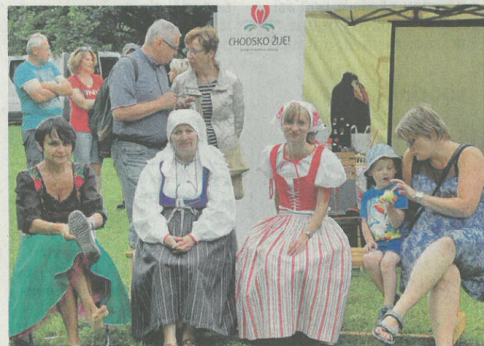
PIVOŇ ŽIJE. Dobové kostýmy, vůně i hudba vtáhly diváky do doby baroka.

„Letošní akce navázala na úspěšný loňský ročník, kdy jsme na Pivoni přivítali bezmála 300 návštěvníků. Snažíme se udělat z toho tradici. Naším hlavním cílem je zpřístupnit lidem Pi-